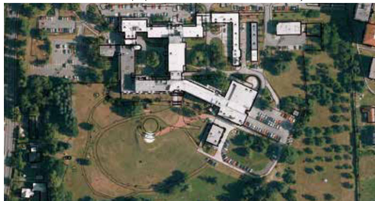
Obr. 4. Situace areálu nemocnice

Velikost areálu činí 6,7 ha a poplatek za odvádění srážkové vody 232 142 Kč/rok.