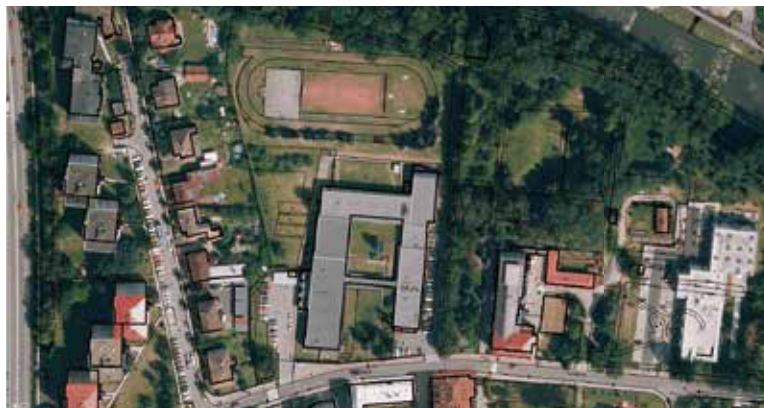
Obr. 2. Situace školního areálu

Velikost areálu činí 1,7 ha a poplatek za odvádění srážkové vody 120 216 Kč/rok.