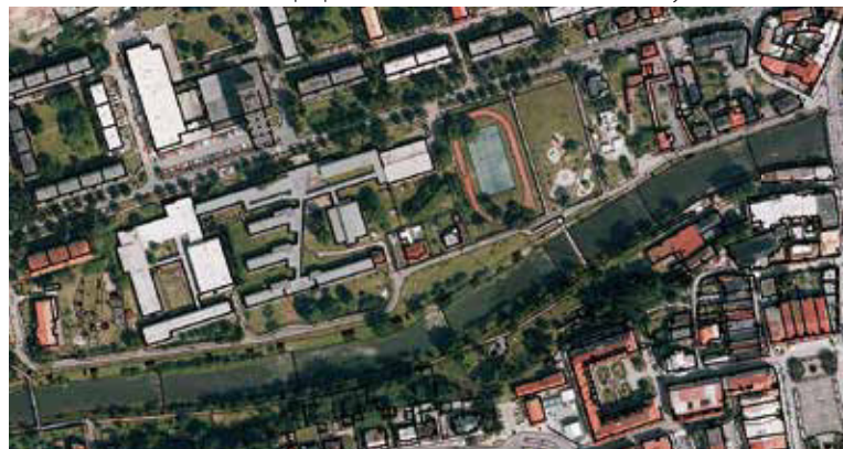
Obr. 3. Situace školního areálu (zdroj: JD TM ZK)

Velikost areálu činí 2,1 ha a poplatek za odvádění srážkové vody 140 149 Kč/rok.